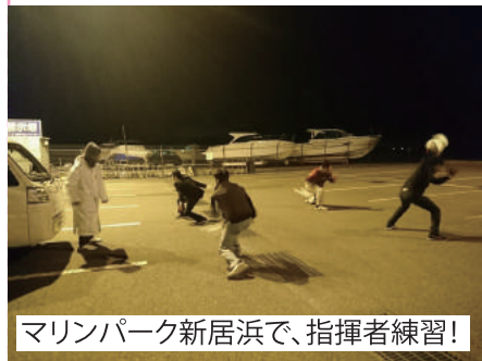
マリナーパーク新居浜で、指揮者練習!