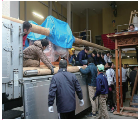
←搬出作業には、4月発足予定の高専新居浜太鼓台保存研究会のメンバーも参加。(1/8)