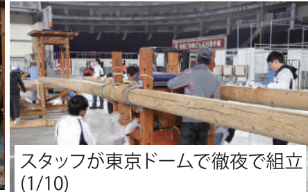
スタッフが東京ドームで徹夜で組立(1/10)