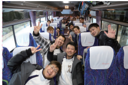
かき夫40人がバス2台で東京へ出発(1/18)