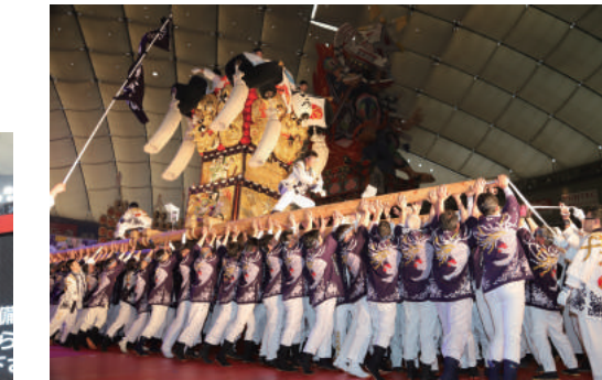
埼玉県入間市からも多くの方が応援参加下さいました。(1/20・1/21)