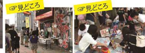
#お化け屋敷 #子どもふろしき市