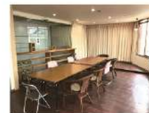
ステージあります。