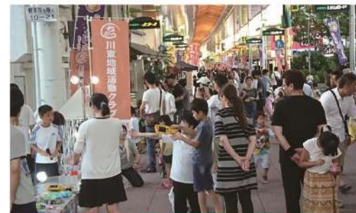
#新居浜 #夜市 #あかがね土曜夜市