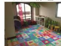
キッズルーム(約10畳)