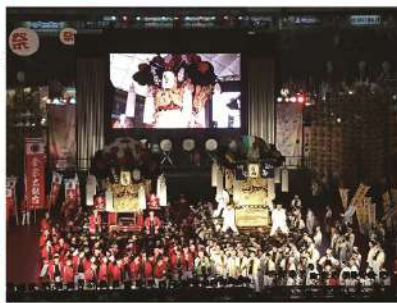
観客へ秋祭りへの来新を呼びかけ